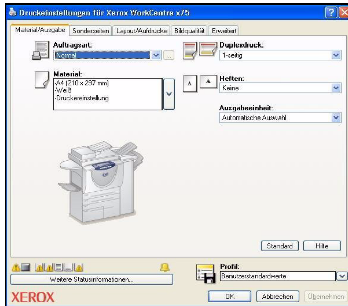
Abbildung 3-1: Benutzeroberfläche des Druckertreibers

Die Funktionen können über folgende Dialogfelder aufgerufen werden: „Material/Ausgabe“, „Sonderseiten“, „Layout/Aufdrucke“, „Bildqualität“ und „Zusatzoptionen“.